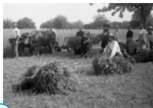
○ moissonner : couper et attacher les gerbes de blé