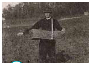
○ semer le blé

Toutes les personnes âgées n'étaient pas d'une famille d'agriculteurs, mais toutes ont aidé les voisins pour la moisson ou la fenaison (récolte du foin). Les enfants ramassaient les grains après le battage, apportaient aux hommes de quoi boire tout au long de la journée.