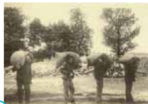
○ ranger les sacs de grains