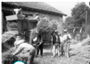
○ battre le blé